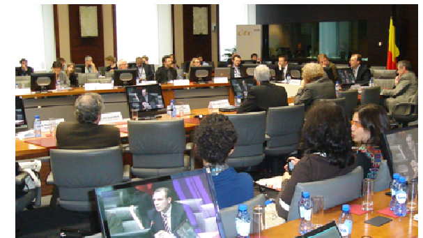
Foto van een nationale conferentie

Synergieën Bijdragen aan projecten en initiatieven.