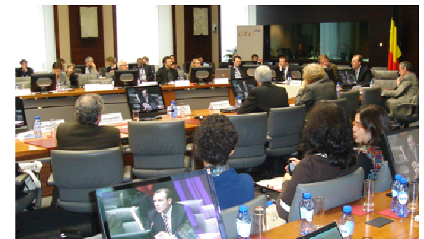
Photo d'une conférence nationale

Synergies Contributions à des initiatives et projets.